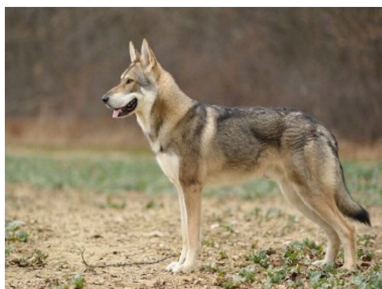
Chien-loup de Saarloos